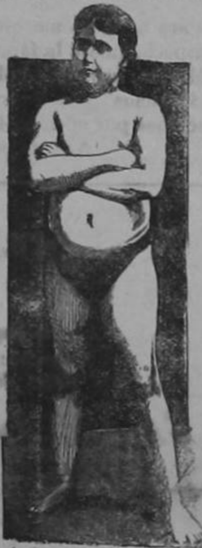
EDAD 11 AÑOS

La transformación maravillosa de un sér endeble y raquítico en un adolescente fuerte, robusto y sano, como lo demuestra su atlética figura, fué obra realizada por la